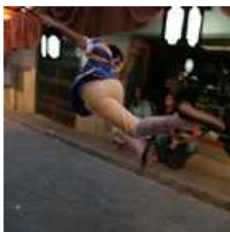
Ball dels Torners