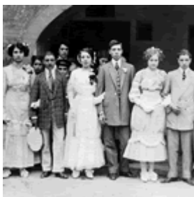
Les Danses de Falset al 1915

http://www.festes.org/directori.php?id=4