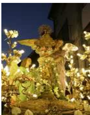
Mare de Déu de Vallivana