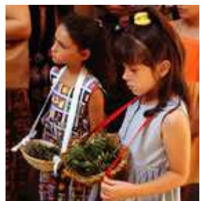
Dues nenes al cercavila de l'espígol