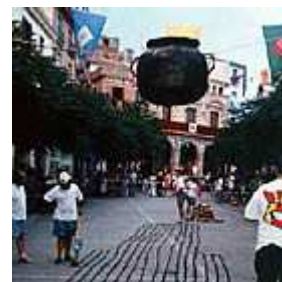
Actuació del Ball de Diables de Falset