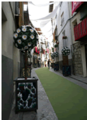
Un dels carrers guarnits