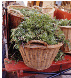
Carro amb les herbes Falset (el Priorat), pels volts del 15 d'agost Les herbes boscanes perfumen la festa major