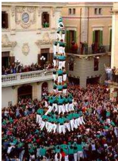
Primer 3 de 10 amb folre i manilles carregat de la història. Castellers de Vilafranca , (15 de novembre de 1998)

O ano de 1998 trouxe consigo a obtenção de mais dois castelos míticos: o 4 de 9 (sem "folre") e o 3 de 10 com "folre e manilles". O primeiro foi descarregado pelos "Minyons de Terrassa" nas Festas de Sant Narcís (25 de outu