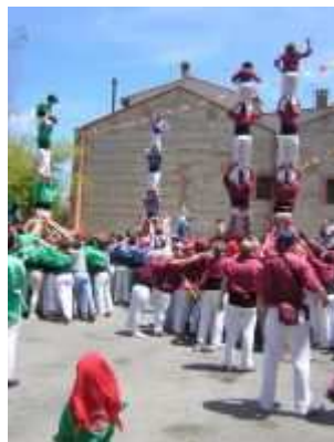
Pilars a la Trobada castellera de Baó del

Després, per Sant Fèlix (30 d'agost) i Tots Sants, els Castellers de Vilafranca realitzaren sengles intents d'aquest castell, que finalment aconseguiren carregar el 15 de novembre a Vilafranca. Una setmana després, els Minyons descarregarien aquest mateix castell en el transcurs de la seva diada després d'un intent desmuntat. Encara durant el segle XX s'aconseguirien dos castells més de gamma extra: el 2 de 8 (sense folre), carregat per primer cop pels Castellers de Vilafranca per Tots Sants de 1999 i el 3 de