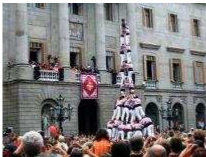
2 de 9 amb folre i manilles dels Minyons de Terrassa (Barcelona, 2006)

Puntals: són els castellers situats sobre les manilles, al nivell de quarts