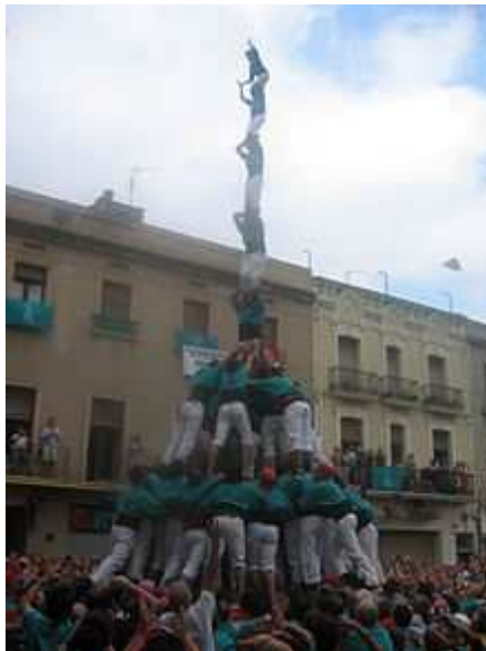
Pilar de 8 amb folre i manilles dels Castellers de Vilafranca

descarregaren el 5 de 9 amb folre, el 3 de 9 amb folre i el pilar de 7 amb folre. Durant aquell any també es va viure una cursa per a assolir el primer castell de 10 pisos de la història. Després de que els Castellers de Vilafranca es plantegessin sense èxit el 4 de 10 amb folre i manilles, els Minyons de Terrassa i els Castellers de Vilafranca començaren a assajar el 3 de 10 amb folre i manilles. Així, el primer intent de 3 de 10 el realitzaren els Minyons durant la seva festa major (5 de juliol), tot i que no es va arribar a carregar.