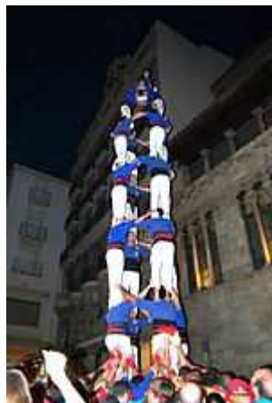
4 de 8 dels Castellars de la Vila de Gràcia a Lleida (24-10-2009)

Tronc : és la part visible del castell, formada pels pisos compresos des dels baixos fins al pis immediatament anterior al de dosos. Determina el grau de dificultat del castell, pel nombre de persones implicades, segons la quantitat i l'alçada de les rengles (cada una de les columnes del castell) del tronc. El tronc està format pels baixos, els segons, (el primer pis visible en castells sense folres), els terços, a sobre dels segons i successius.